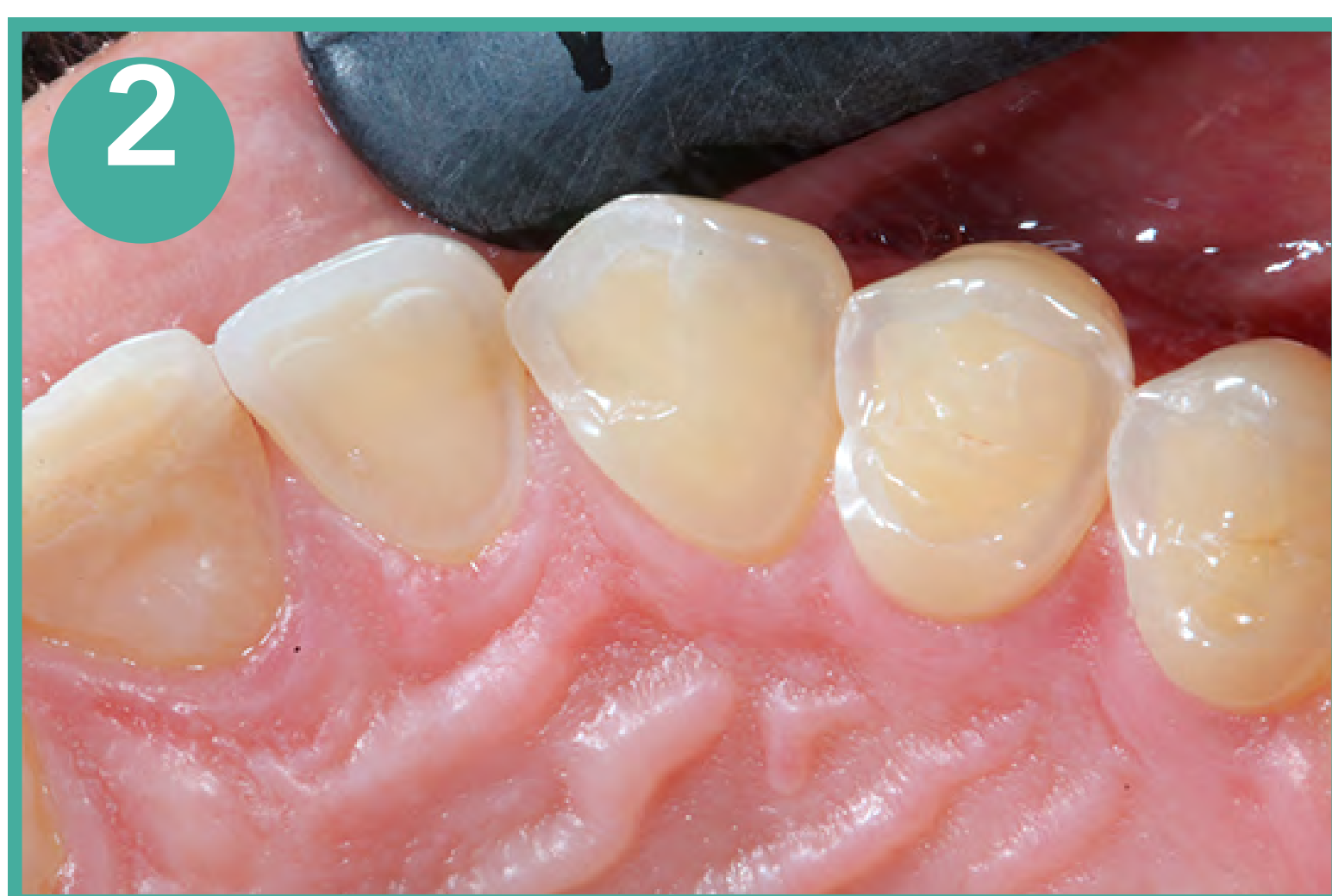
Descoloração do dente com a exposição da dentina