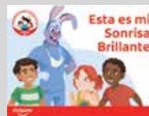
Esta es Mi Sonrisa Brillante Lector Emergente**