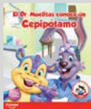
Cuento El Dr. Muelitas Conoce a un Cepipótamo*