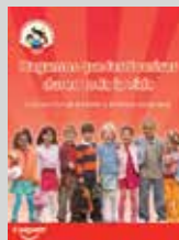
Folleto hagamos que las Sonrisas Duren Toda la Vida