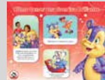
Póster Cómo Tener una Sonrisa Brillante