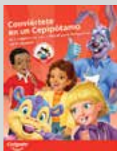
Guía de actividades Conviértete en un Cepipótamo

Mejore el aprendizaje en clase y la participación de la familia con